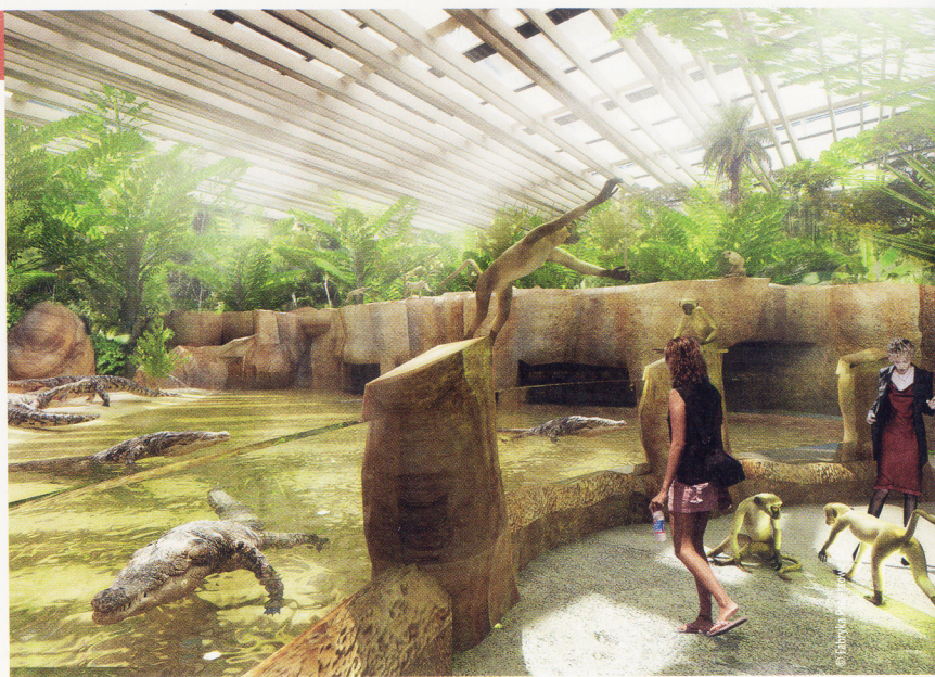
ekspozycja poświęcona dżungli Kongo

AUTORZY Mariusz Szlachcic, Dorota Szlachcic (we współpracy z: Wojciechem Napierałą, Andrzejem Hnatiukiem, Pawłem Osmakiem i Maciejem Marzeckim)